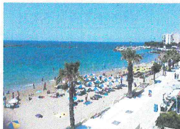
Paleochora in Chania, Crete